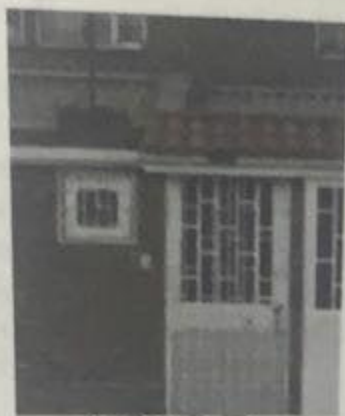
Carrera 73C # 25F-14, Bogotá D.C.

El funcionario procede a verificar la dirección Carrera 73C # 25F-14, manifestando lo siguiente, si existe la dirección aportada y es una vivienda ubicada en el sector de Modelia, la cual consta de dos pisos con fachada en ladrillo, portón blanco de ingreso a parqueadero de la vivienda y puerta de acceso peatonal, al parecer se encuentra habitada por cuanto tiene cortinas.